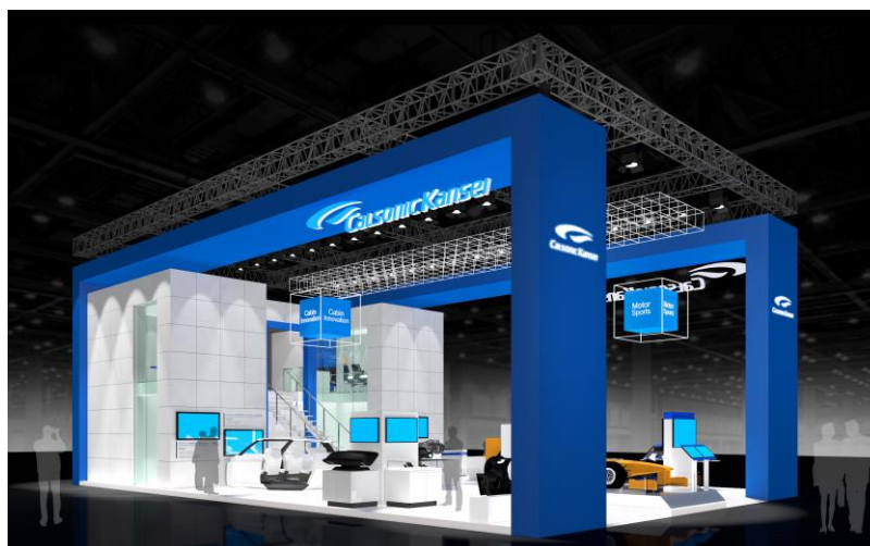
< 展示ブースイメージ ※予告なく変更する場合があります。 >

( https://www.calsonickansei.co.jp/exhibition/201904/ ) にて、4月16日から 公開予定です。