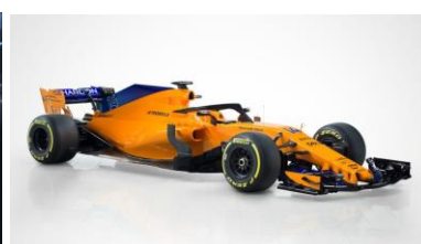
<F1 マシンのイメージ図>

世界的ネットワークを持つ独立したティア1サプライヤーとして、世界基準の最新技術と製品をお見せするカルソニックカンセイブースに、是非ともご期待ください。