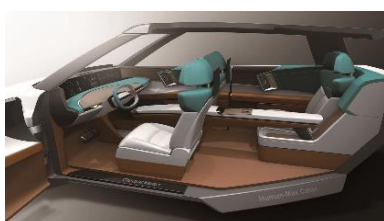
<Human-Max Cabin のイメージ図>

また、今回は、カルソニックカンセイがオフィシャルサプライヤーを務めるマクラーレン・レーシングのF1マシンを展示。モータースポーツ活動へのひたむきな情熱を、映像とともにご紹介します。