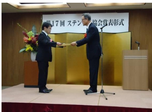
◀ 3月27日 第17回ステンレス協会賞表彰式を受賞風景（鉄鋼会館）